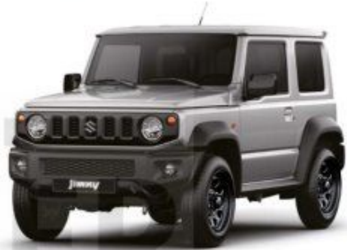
Silky Silver Metallic (Z2S) 1)