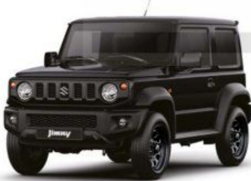
Bluish Black Pearl 3 (ZJ3) 1)