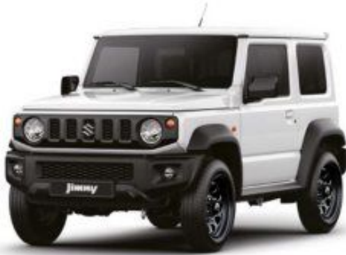
Superior White (26U)