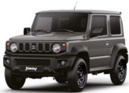
Medium Gray (ZVL)