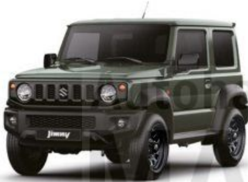
Jungle Green (Z2C)