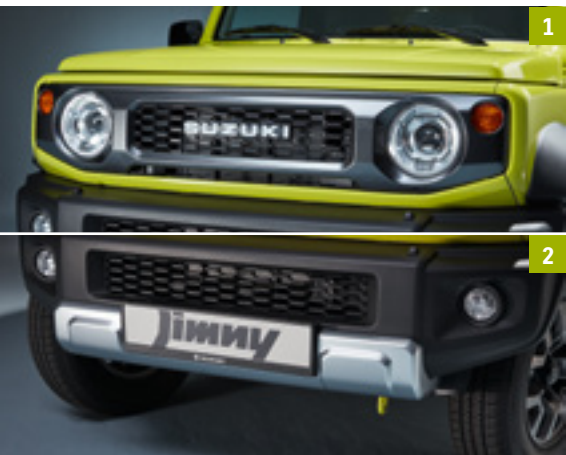
1 | Retro Grill LJ10 Mit Suzuki Logo. Art.-Nr. 9911C-78R00-ZSC